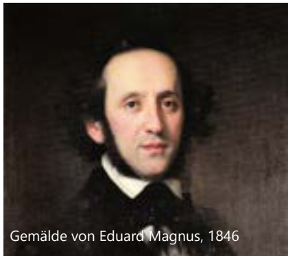
Gemälde von Eduard Magnus, 1846