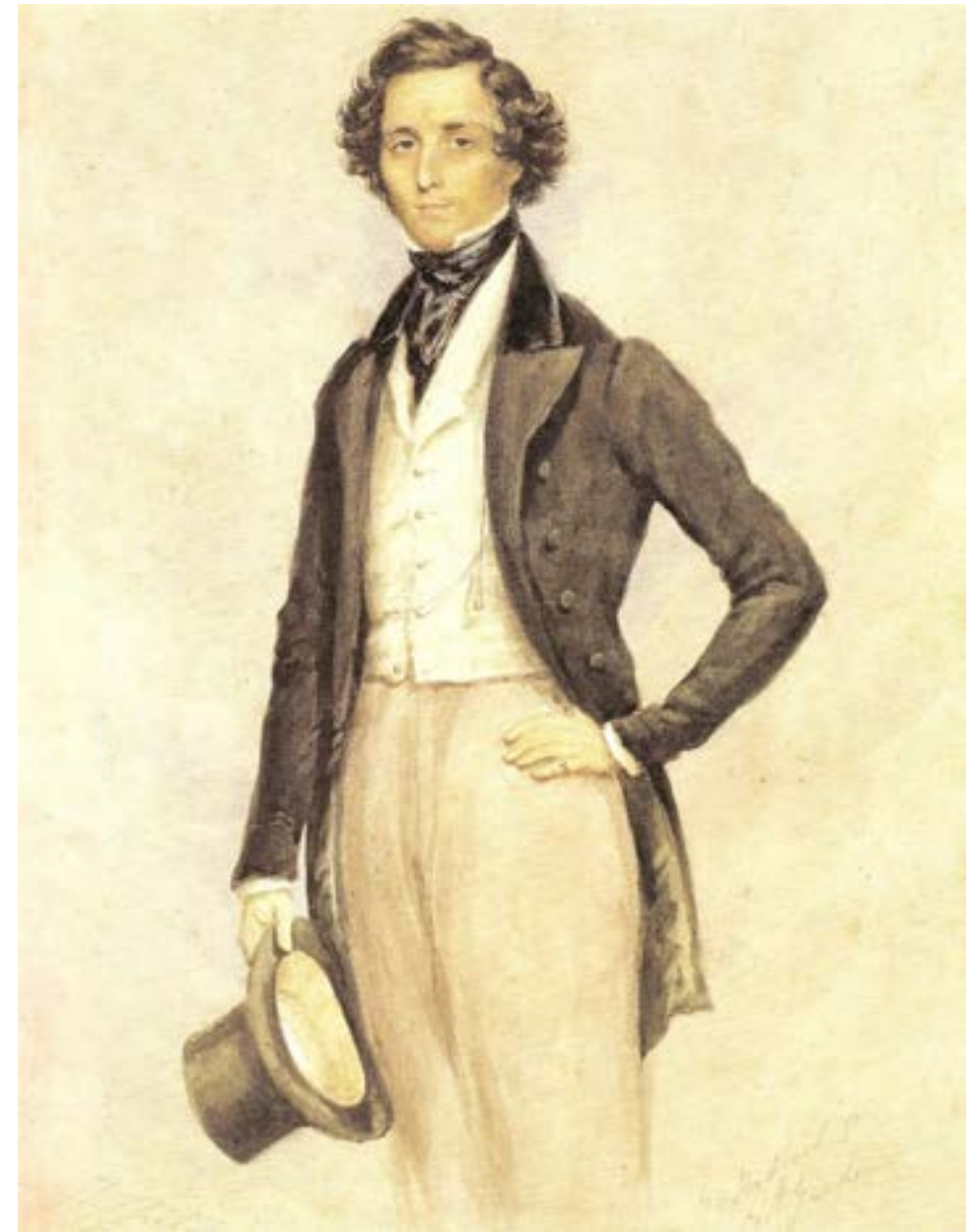
James Warren Childe, Aquarell von 1830

Am 14. Juni 2026 werden zwei Kantaten aus diesem Notenbestand erstmals seit 1803 und 1805 im Kantatengottesdienst zum 40. Kissingener Sommer in der Erlöserkirche wieder aufgeführt.